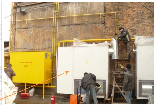
ТС 300 Е/К