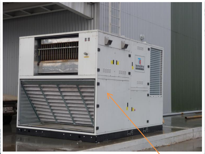
CF 600 CM/P