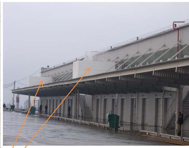
CF 600 CM/P